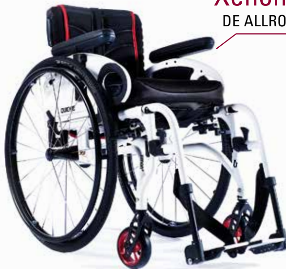
Xenon 2 SA DE ALLROUNDER