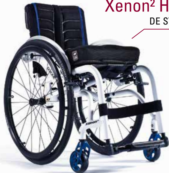
Xenon 2 Hybrid DE STERKSTE