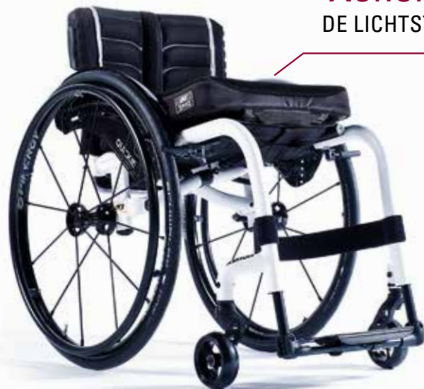
Xenon 2 DE LICHTSTE

Alle Xenon 2 modellen zijn succesvol gecrashtest volgens ISO 7176-19 met een 4-punts vastzetsysteem in combinatie met een transporthulpset, zodat de rolstoel geschikt is als zitplaats tijdens het vervoer.